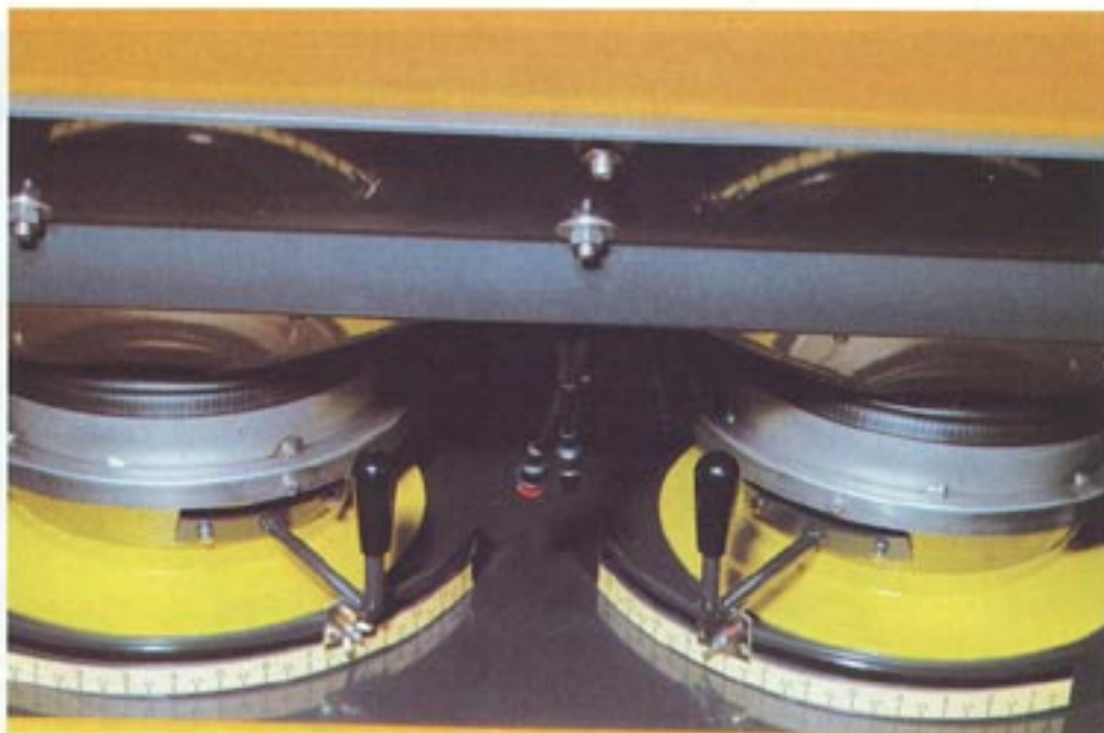
Leve di regolazione indipendenti che consentono di posizionare il punto di caduta del fertilizzante sui dischi distributori garantendo conseguentemente l'ampiezza della gittata di distribuzione/Regulation levers adjusting fertilizer falling point on the distributor disk for the width of distribution throw

surface area fertilised, the effective dose applied and the moment to moment speed ahead. Systems for weighing the material left in the hopper are used to check how far the planned spread has gone.