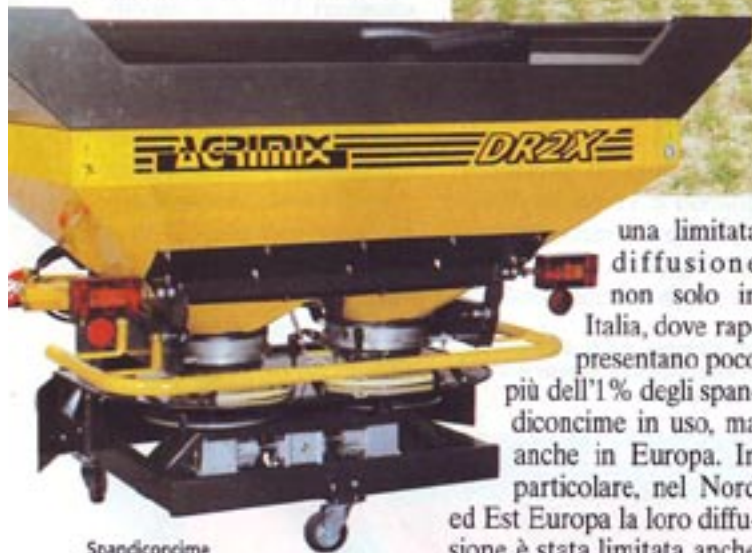
Spandiconcime centrifugo a doppio disco Two-disk centrifugal spreader

struttiva rispetto alle macchine a distribuzione centrifuga e dei maggiori costi di acquisto che ne seguono, ha